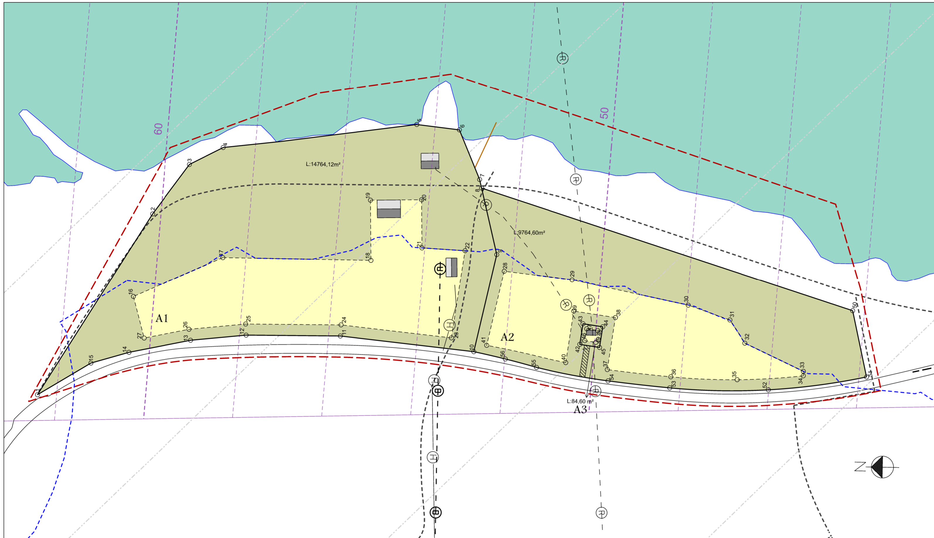
Tillaga að deiliskiplagi