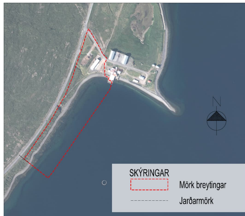
Mynd 1 Afmörkun deiliskipulags í tillögu að breytingu.

Við nánari hönnun og útfærslu á verksmiðjunni hefur komið í ljós að þörf er á stærra hráefnissvæði en áætlað var í fyrstu, til að hægt sé að koma í veg fyrir að grugg berist til sjávar úr hráefnis- og setlónum með því að nota fullnægjandi hreinsitækni. Stefna fyrirtækisins er að hámarka hreinsun frárennslisvatns úr hráefnisþróum. Ekki er gerð breyting á skilmálum um byggingar innan deiliskipulagsvæðis.