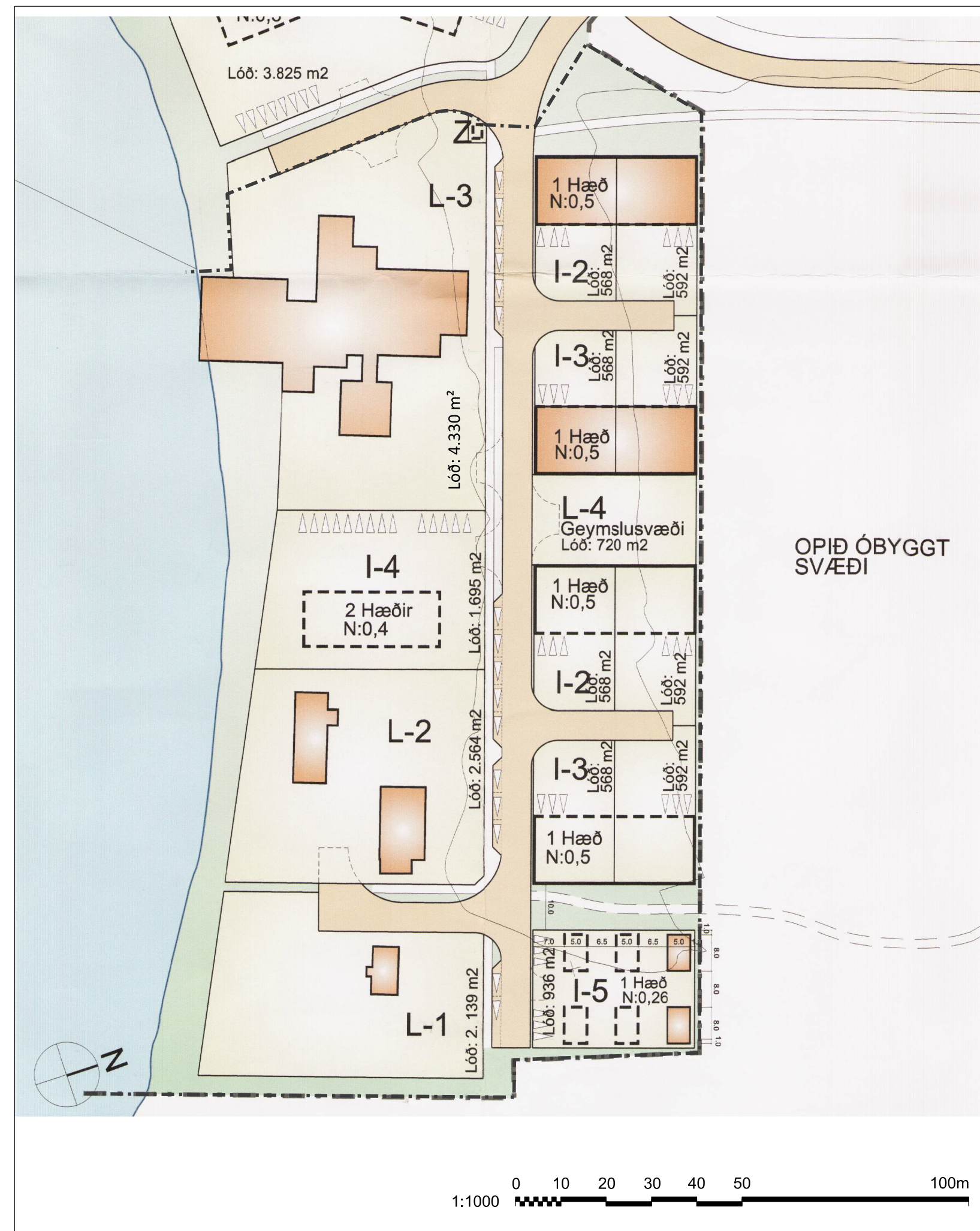
Gildandi deiliskipulag mkv. 1:1000