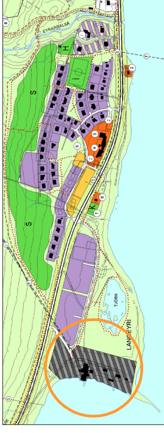
Úr Aðalskipulagi Súdavíkurhrepps 1999-2018.